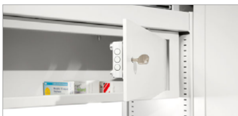
BTM - Opiatetresor