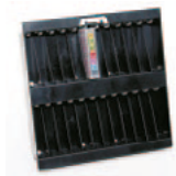
Auto-Pac 8 mm / 24