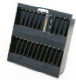
Auto-Pac 4 mm / 24

Gerne ermitteln wir gemeinsam mit Ihnen den Bedarf an Boxen für das Standard Regal. Zudem planen und richten wir Ihren Archivraum ein.