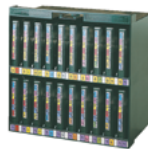
Auto-Pac 3480 / 3590 / 20

In dieses Regal passen alle nebenstehenden Boxen. Stets übersichtlich und griffbereit.