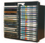
Auto-Pac CD-Rom / 36