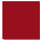
Rubinrot RAL 3003