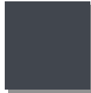
Anthrazitgrau RAL 7016