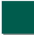
Moosgrün RAL 6005

Bei Zwei-Farben-Beschichtungen (Korpus und Fronten unterschiedlich) gilt: • Die Korpusbeschichtung bestimmt den Farbaufpreis Das heißt für Sie: • Einfachste Farbaufpreisberechnung nur anhand der Korpusfarbe • Über 100 Farben und Farbkombinationen ohne Mehrpreis!