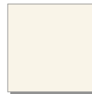
Perlweiß RAL 1013