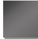
Grau metallic DB 703 glatt