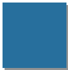
Ferneblau RAL 5023