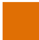
Gelborange RAL 2000