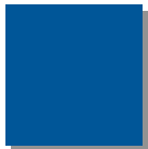
Enzianblau RAL 5010