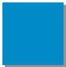
Lichtblau RAL 5012