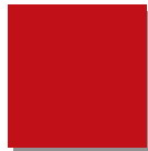
Feuerrot RAL 3000