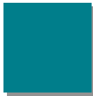
Wasserblau RAL 5021