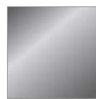
Graualuminium RAL 9007