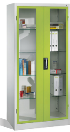
Medikamentenschrank mit Glas-Türen