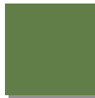
Resedagrün RAL 6011