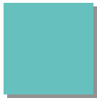
Lichtgrün RAL 6027