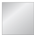
Weißaluminium RAL 9006