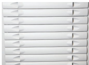
HotLok in 1 HE auch in lichtgrau erhältlich