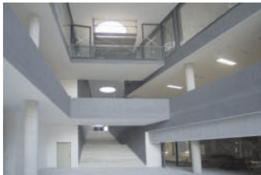
DeTwo - Neuste Technik im Neubau der Bibliothek der Bauhaus-Universität Weimar

Bibliothek der Bauhaus-Universität Weimar setzt für 120 Benutzerarbeitsplätze auf DeTwo