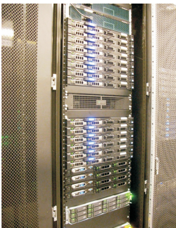
Switch Airbox im Rack