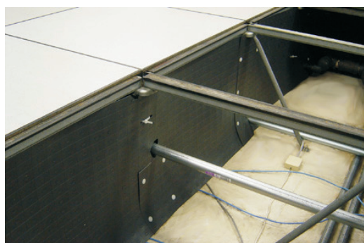
Einbau im Doppelboden